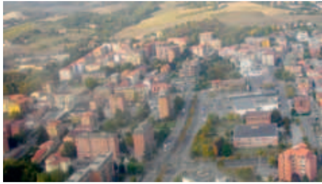
Via Verdi: nell'angolo in basso a destra la scuola Dante

Serve sia in classe che a casa. A Casale comincia l'Alighieri-Trevigi